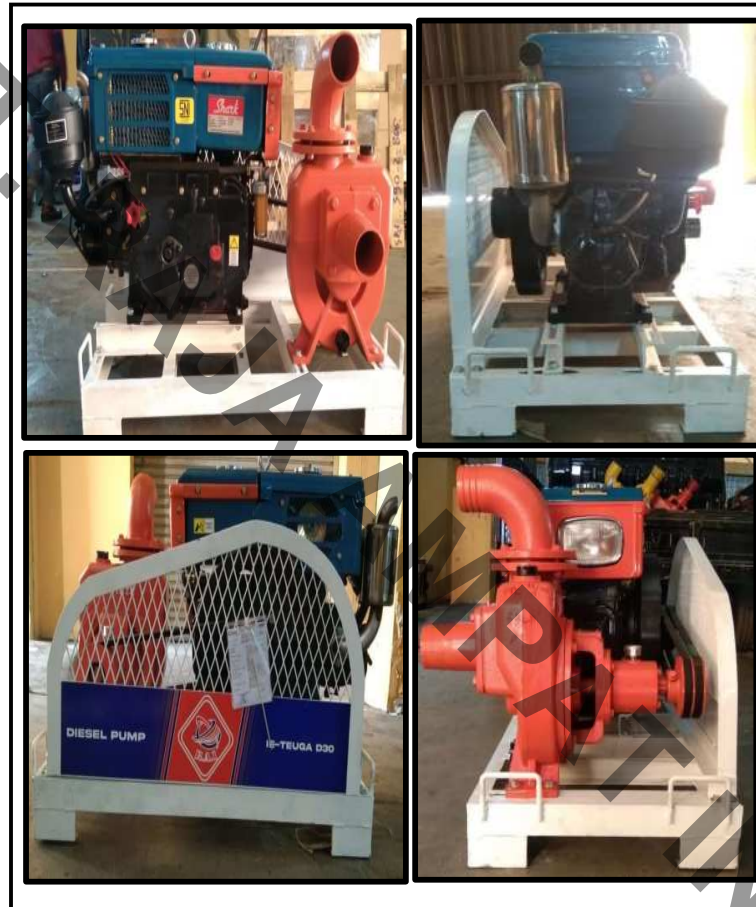
Gambar-3. Produk pompa sentrifugal

PERHATIAN : 1. Hasil pengujian/kalibrasi ini hanya untuk contoh/alat yang diuji/dikalibrasi 2. Dilarang mengutip/menyalin sebagian isi laporan/sertifikat ini